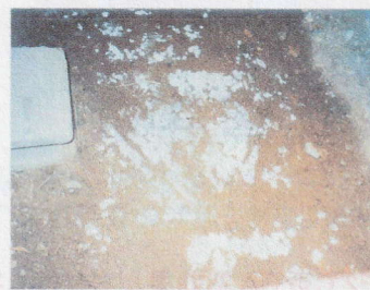
土壌に生えたカビ